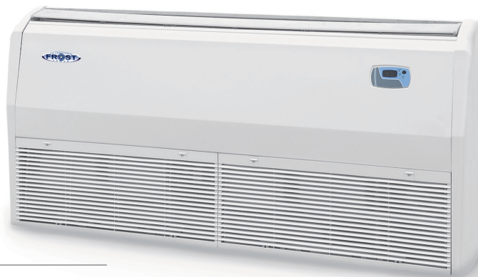
UNITÀ INTERNA INDOOR UNIT