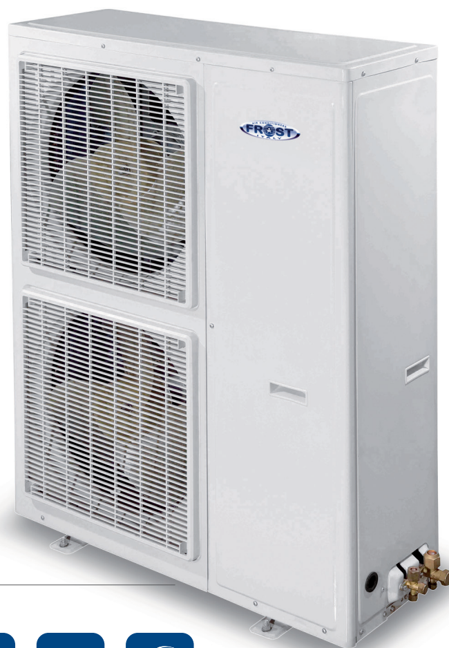
UNITÀ ESTERNA OUTDOOR UNIT